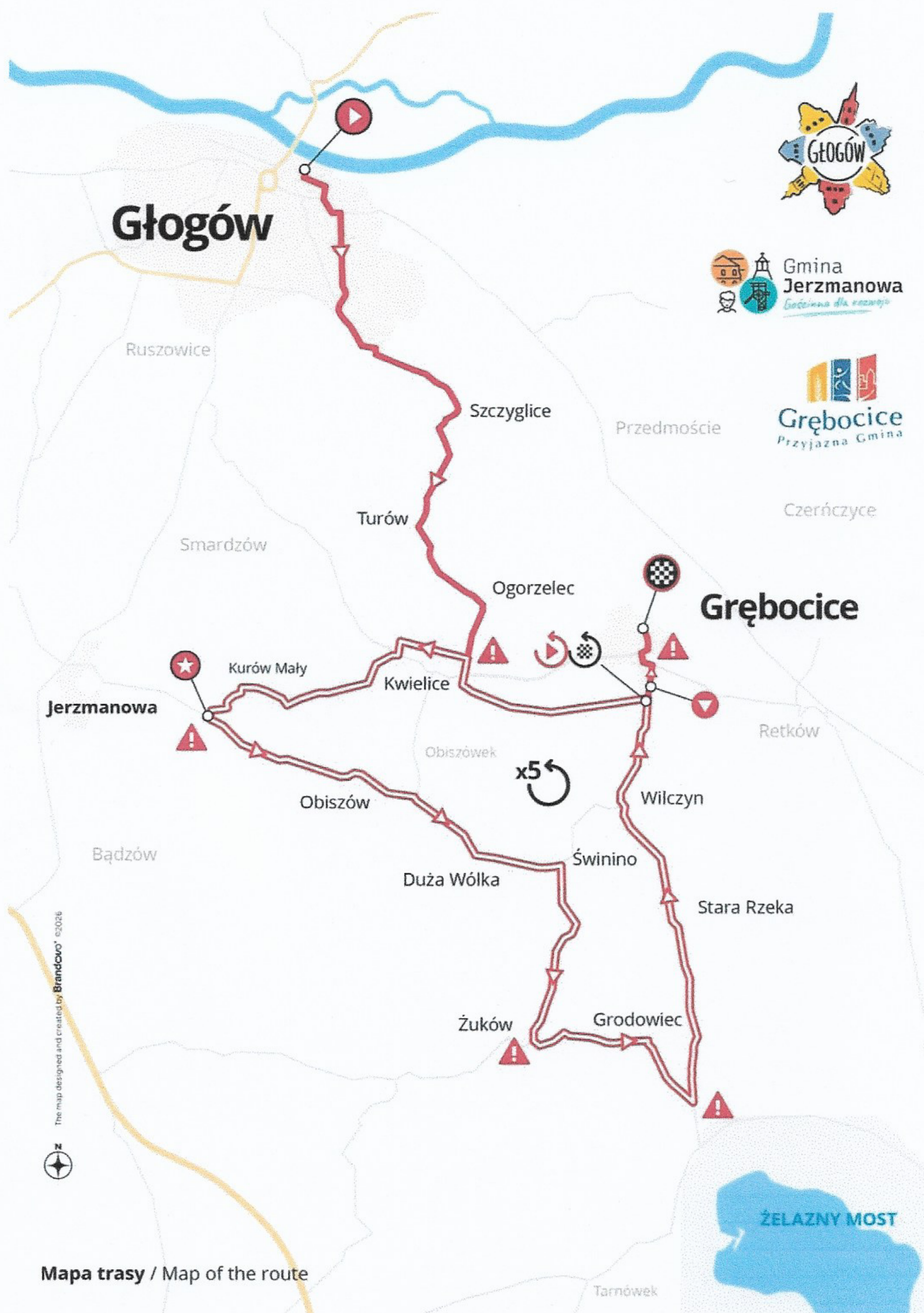
Mapa trasy / Map of the route